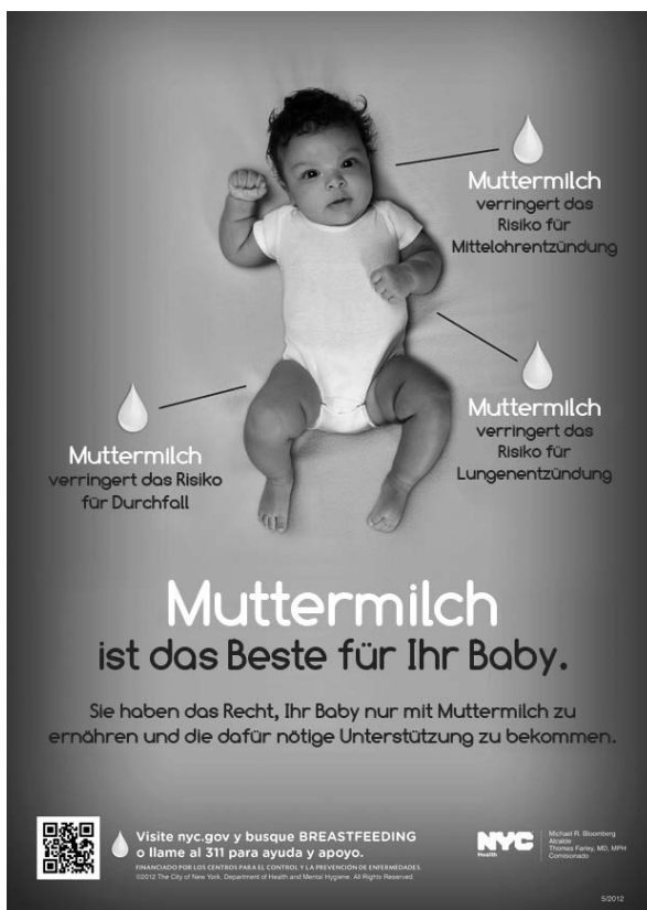
Abb. 4. New York City Department of Health poster, 2012

(36) Stellen Sie offene Fragen, wie z.B. „Was haben Sie über das Stillen gehört?“, um sich nach der für dieses Kind geplanten Ernährung zu erkundigen. Stellen Sie Aufklärungsmaterial zur Verfügung, das die vielen Vorteile des Stillens für das Baby und die Mutter hervorhebt.