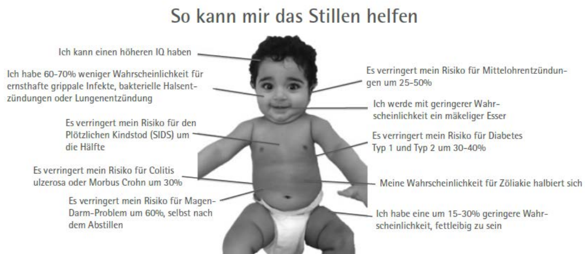
Abb. 6: „Vorteile des Stillens“ erstellt von Dr. Swathi Vanguri

Zu den vorgeschlagenen Ausbildungsthemen gehören die Risiken der künstlichen Ernährung, die Physiologie der Laktation, der Umgang mit häufigen Stillproblemen, medizinische Kontraindikationen für das Stillen und praktische Fertigkeiten zur Beurteilung des Anlegens und des adäquaten Milchtransfers. Stellen Sie dem medizinischen Fachpersonal in Ihrer Praxis Schulungsunterlagen zum schnellen Nachschlagen zur Verfügung (Bücher, Protokolle, Internetlinks usw.). (Tabelle 1)