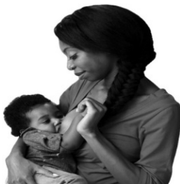
Abb. 2. Beispiel für ethnisch diverse Bilder, die das Stillen in einem positiven Licht darstellen.

In Abb. 2-4 finden Sie Beispiele für ethnisch vielfältige Bilder, die das Stillen in einem positiven Licht darstellen