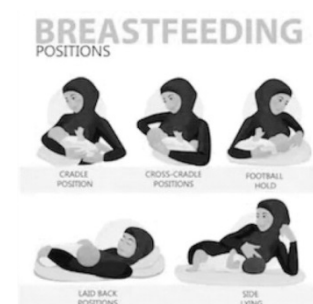
Abb. 3: Stillpositionen