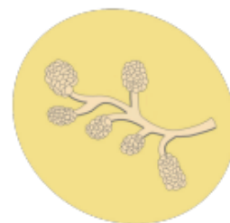
En bonne santé